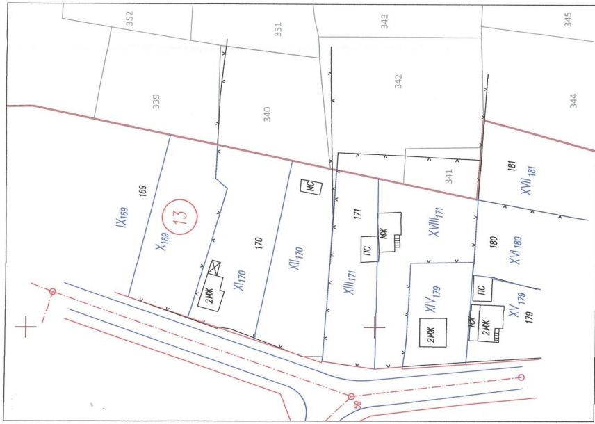
ИЗВАДКА ОТ ДЕЙСТВИЯ РЕГУЛАЦИОНЕН ПЛАН